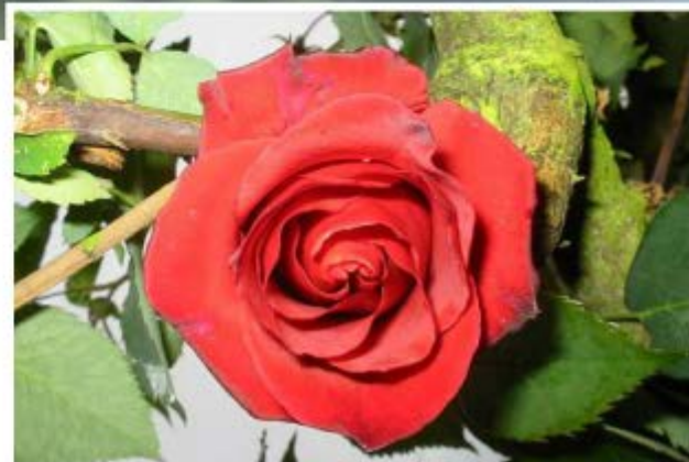
Le rosier peut vivre aussi longtemps qu'un être humain

En attendant, le parc William-Farcy d'Offranville célèbre son 30 e anniversaire avec une foule d'animations en ce grand week-end du 1 er mai ! ■